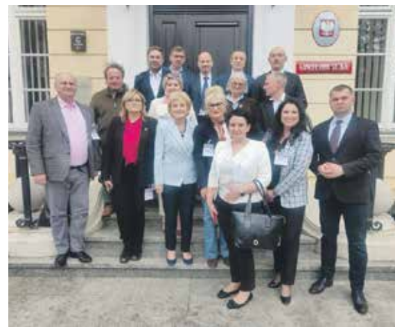
Uczestnicy posiedzenia Żuławskiego Zespołu Parlamentarnego

prac nad Programem dla Żuław, a także założenia i finansowanie 10-letniego