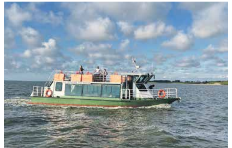
Statek „Generał Kutrzeba” będzie obsługiwał linię Frombork – Piaski – Frombork

wych statków pasażerskich w Polsce. Ten cumujący w tolkmickim porcie jest dopuszczony do żeglugi na Zalewie Wiślanym. „Zefir” posiada klimatyzowany salon, dwa silniki, ma 25 metrów długości i 6 metrów szerokości, 60 miejsc siedzących przy stołach w salonie, 48 miejsc siedzących na pokładzie słonecznym.