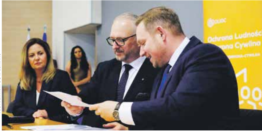
Umowę z wojewodą Radosławem Królem podpisał wójt Gminy Lelkowo Łukasz Skrzyszewski

Gmina Lelkowo otrzymała znaczące wsparcie finansowe na realizację inwestycji związanej z bezpieczeństwem mieszkańców. Przedstawiciele samorządu podpisali z wojewodą warmińsko-mazurskim Radosławem Królem umowę na dofinansowanie pierwszego etapu zadania pod nazwą „Budowa magazynu obrony cywilnej w technologii lekkiej hali magazynowej o wymiarach 10 x 30 metrów”.