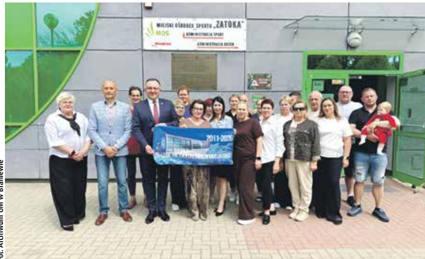
Fot. Archiwum UM w Braniewie

To miejsce spotkań, sportu, rehabilitacji i codziennej aktywności mieszkańców. Braniewski basen obchodzi 15-lecie, a jego historia pokazuje, jak długa i wymagająca była droga do powstania miejskiej pływalni.