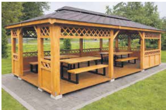
Wizualizacje nowego miejsca rekreacji w Gładyszach

Gmina Wilczęta planuje realizację kolejnego zadania, którego celem jest poprawa jakości przestrzeni publicznej oraz stworzenie mieszkańcom lepszych warunków do wypoczynku i integracji. W ramach programu „Małe Granty Sołectwie Marszałka Województwa Warmińsko-Mazurskiego” w 2026 roku przygotowane zostało zadanie pod nazwą „Tu się spotykamy, tu odpoczywamy – utworzenie placu rekreacyjnego w Gładyszach”.