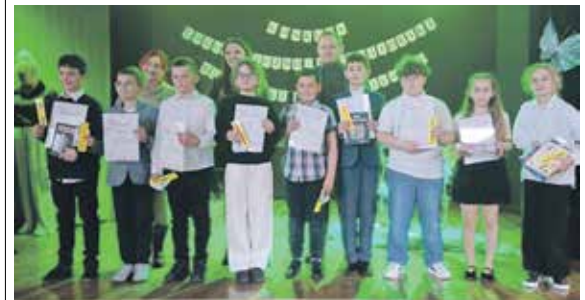
Konkurs cieszył się dużym zainteresowaniem uczniów szkół podstawowych

Emocje, świetna zabawa i prawdziwy pokaz językowych umiejętności – tak wyglądał Międzyszkolny Konkurs Logopedyczno-Recytatorski „Wierszyki łamiące języki”, który odbył się w Lelkowie. W wydarzeniu wzięli udział uczniowie klas I–III szkół podstawowych z Lelkowa, Zagaje i Pieniężna.