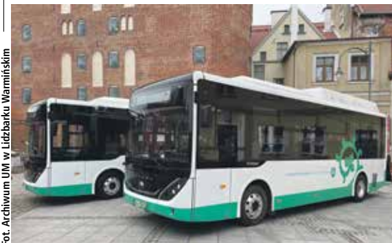
Takie ekologiczne autobusy jeżdżą już od kilku lat po ulicach Lidzbarka Warmińskiego

Braniewo otrzyma 3,6 mln zł dofinansowania na zakup niskoemisyjnych autobusów dla komunikacji miejskiej. Całkowita wartość projektu wynosi 4,2 mln zł. Inwestycja zostanie zrealizowana dzięki wsparciu z programu regionalnego Fundusze Europejskie dla Warmii i Mazur 2021-2027.