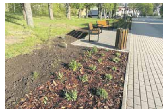
Projekt jest kolejnym krokiem w kierunku tworzenia nowoczesnej, ekologicznej i przyjaznej przestrzeni miejskiej