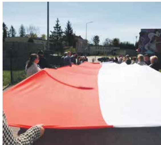
Po nabożeństwie mieszkańcy wspólnie unieśli imponującą, 20-metrową białą-czerwoną flagę